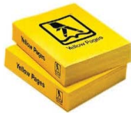
Telephone Books Directorios telefónicos