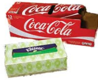
Soda/Tissue Boxes Cajas de soda/ papel desechable