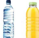
ALL Plastic Beverage Bottles Todas la Botellas de Bebidas de Plástico