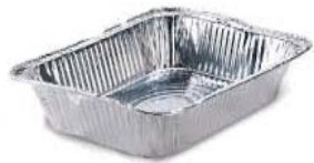
Aluminum Trays and Foil Products Bandejas de aluminio