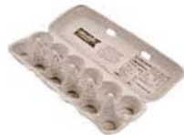
Paper Egg Cartons Papel Cartón de Huevos