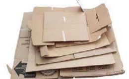
Flattened Corrugated Cardboard Boxes Carton Aplanado