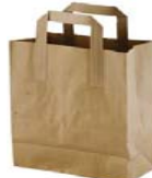
Paper Bags Bolsa de papel