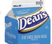
Juice/Milk Cartons/Pouches Empaques de Cartón de Jugo/Leche

NO: GLASS, wood, clothing, electronics, green waste, styrofoam, food waste, food contaminated materials, or plastic bags. NO: VIDRIO, madera, electrónicos, residuos verdes, espuma de poliestireno, residuos de comida, materiales contaminados de comida, o bolsas de plástico.