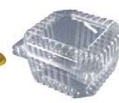
Clamshell Packaging Cubiertas de Plástico