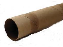
Paper Towel/Toilet Paper Tubes Tubos de toallas de papel y papel de baño