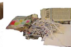
Mixed Paper, Magazines Place Shredded Paper in clear bags. Papel mixto/Revistas. Ponga el papel triturado en Bolsas de Plástico Transparentes.