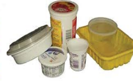
Plastic Containers Contenedores de Plástico