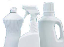
ALL Plastic Cleaner Bottles Todas las botellas de limpiadores de plásticos